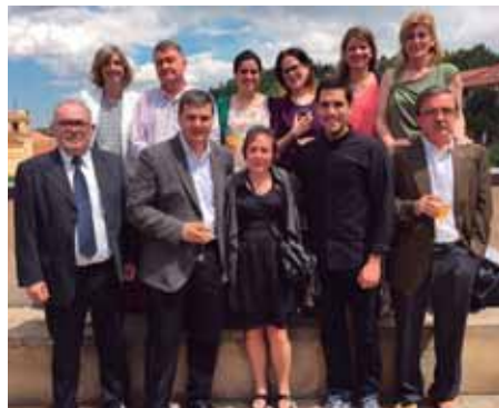
En la foto, organizadores del congreso.

Tanto la Reunión de Residentes como el XXX Congreso de la SOCALMI suponen un aprendizaje, así como conocer y actualizar procedimientos o técnicas, que nos ayudarán a comprender y realizar cada vez mejor la práctica clínica, afrontar los nuevos cambios del sistema sanitario y de la atención al paciente, y la organización de las áreas de salud como unidades funcionales.